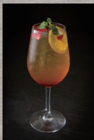
ジャスミンレモネード Jasmine Lemonade